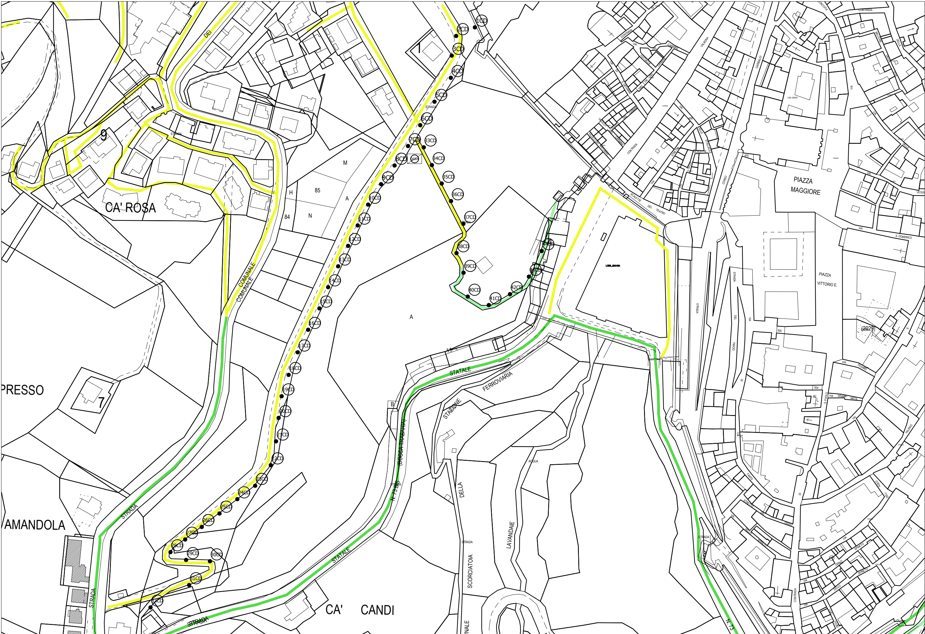
PLANIMETRIA DI RILIEVO scala 1:2000

PALO BASSO - SOSTITUZIONE PALO E APPARECCHIO